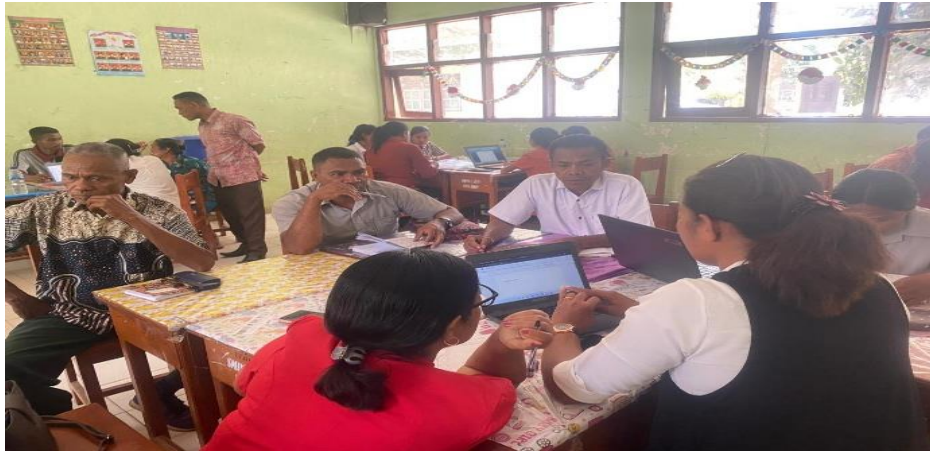
Gambar 3. Kelompok 1 merancang modul ajar inovatif dengan pendekatan deep learning

pedagogik guru dalam merancang pembelajaran aktif sesuai implementasi Kurikulum Merdeka.