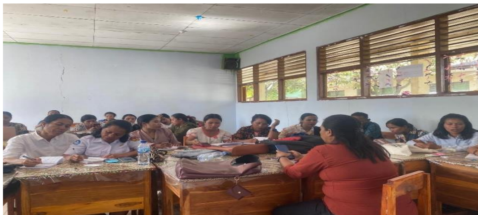
Gambar 2. Pemateri memberikan penguatan materi

Tahap Rancang dilakukan melalui penyusunan dan pendampingan modul ajar inovatif. Guru didampingi secara langsung dalam menentukan tujuan pembelajaran, menyusun aktivitas pembelajaran berbasis eksplorasi dan kolaborasi, serta merancang asesmen diagnostik, formatif, dan sumatif. Hasil pendampingan menunjukkan bahwa guru mulai mampu menyusun modul ajar yang lebih sistematis, kreatif, dan berorientasi pada keterlibatan aktif peserta didik. Sebagian besar peserta juga mulai mampu mengintegrasikan aktivitas refleksi, pemecahan masalah, dan pembelajaran kontekstual ke dalam modul ajar yang disusun. Hal ini menunjukkan adanya peningkatan kemampuan