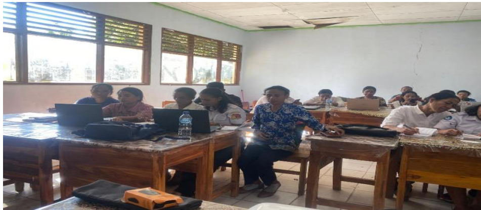
Gambar 1. Guru berdiskusi mengenai kebutuhan guru terkait pemahaman tentang pendekatan deep learning dan penyusunan modul ajar inovatif

mendiskusikan penerapan pembelajaran kontekstual dan aktivitas berbasis pemecahan masalah. Hasil kegiatan menunjukkan bahwa guru mulai memahami pentingnya pembelajaran yang berpusat pada peserta didik serta mampu mengidentifikasi karakteristik modul ajar berbasis deep learning . Temuan ini sejalan dengan penelitian Parisu dan Saputra (2025) yang menyatakan bahwa penerapan deep learning mampu menciptakan pengalaman belajar yang lebih kontekstual dan bermakna bagi peserta didik sekolah dasar.