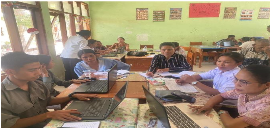
Gambar 4. Kelompok 2 merancang modul ajar inovatif dengan pendekatan deep learning

Tahap Demonstrasi merupakan tahap implementasi awal dari modul ajar inovatif yang telah disusun guru selama proses pendampingan. Pada tahap ini, guru mempresentasikan sekaligus mempraktikkan modul ajar yang telah dikembangkan melalui kegiatan simulasi atau microteaching . Guru menunjukkan langkah-langkah pembelajaran mulai dari kegiatan pendahuluan, inti, hingga penutup pembelajaran dengan memanfaatkan metode, media, dan asesmen berbasis deep learning . Melalui kegiatan demonstrasi, guru memperoleh pengalaman nyata dalam menerapkan pembelajaran aktif, kolaboratif, dan berbasis pemecahan masalah sehingga keterampilan mengajar dan rasa percaya diri guru meningkat.