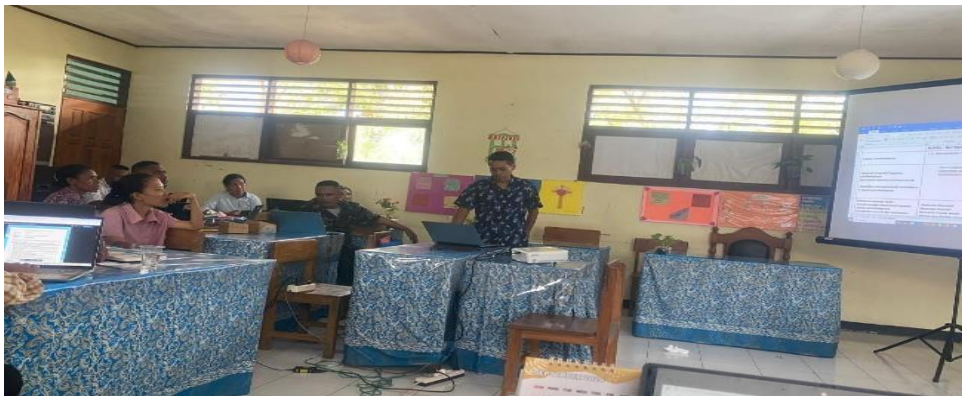
Gambar 6. Microteaching oleh kelompok 2 berdasarkan rancangan modul ajar

Tahap Supervisi merupakan tahap pendampingan lanjutan untuk memastikan keberlanjutan implementasi modul ajar inovatif berbasis deep learning di sekolah. Supervisi dilakukan secara daring melalui grup WhatsApp sebagai media komunikasi, koordinasi, dan konsultasi antara tim pendamping dan peserta kegiatan. Guru mengirimkan modul ajar dan video implementasi pembelajaran melalui Google Drive sebagai bahan observasi dan evaluasi penerapan deep learning di kelas. Kegiatan supervisi memberikan dampak positif terhadap keberlanjutan program karena guru tetap memperoleh umpan balik dan pendampingan setelah kegiatan pelatihan selesai. Selain itu, supervisi juga membantu guru dalam mengatasi kendala implementasi pembelajaran di sekolah masing-masing.