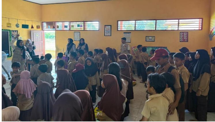
Gambar 4. Tahap evaluasi dan refleksi

Tahap evaluasi dan refleksi dilakukan untuk mengetahui efektivitas pelaksanaan kegiatan sosialisasi dan pembelajaran IPS dalam meningkatkan kesadaran anti-bullying siswa. Evaluasi dilakukan melalui observasi perilaku siswa selama kegiatan berlangsung, diskusi reflektif, serta pemberian pertanyaan sederhana untuk mengukur pemahaman siswa terhadap materi yang telah disampaikan. Guru juga dilibatkan dalam proses evaluasi untuk memberikan masukan terkait perubahan sikap sosial siswa setelah kegiatan dilaksanakan.