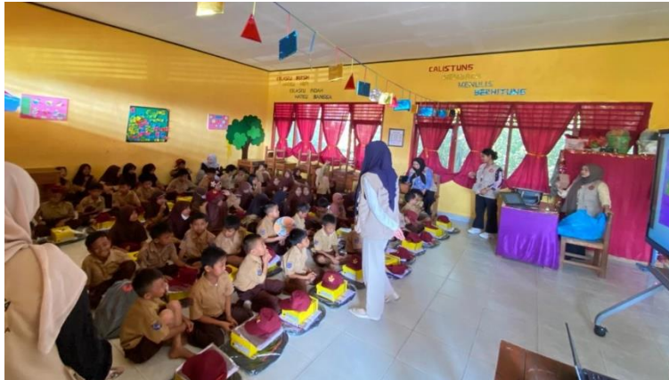
Gambar 3. Tahap penguatan kesadaran anti-bullying melalui pembelajaran IPS

penggunaan contoh kasus sederhana yang dekat dengan kehidupan sehari-hari siswa. Siswa diajak untuk mengidentifikasi perilaku yang termasuk bullying dan perilaku yang mencerminkan sikap saling menghargai. Pendekatan ini bertujuan untuk membangun kesadaran awal siswa bahwa bullying merupakan tindakan yang tidak dapat dibenarkan dalam kehidupan sosial, baik di sekolah maupun di luar sekolah.