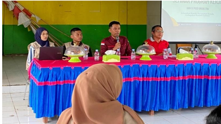
Gambar 1. Tahap Persiapan

Tahap persiapan dilakukan sebagai langkah awal sebelum pelaksanaan kegiatan di sekolah. Pada tahap ini, tim pengabdian melakukan koordinasi dengan pihak sekolah, khususnya kepala sekolah dan guru kelas, untuk menyepakati waktu, tempat, serta teknis pelaksanaan kegiatan. Selain itu, dilakukan identifikasi awal terhadap kondisi sosial siswa dan potensi permasalahan yang berkaitan dengan perilaku bullying di lingkungan sekolah. Tim pengabdian juga menyiapkan perangkat pendukung kegiatan berupa materi sosialisasi, media pembelajaran IPS, serta instrumen evaluasi sederhana yang disesuaikan dengan tingkat perkembangan siswa sekolah dasar.