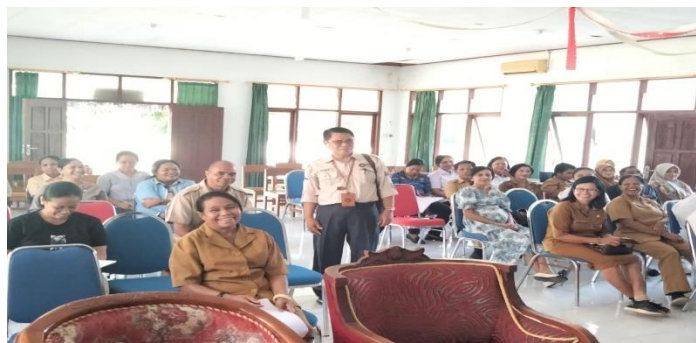
Gambar 2. Tim Melakukan Pendampingan

Sebagai bentuk evaluasi keberhasilan pelatihan, dilakukan pretest dan posttest menggunakan kuesioner untuk mengukur peningkatan pemahaman peserta terhadap komunikasi total. Selain itu, disebarkan pula kuesioner kepuasan peserta guna menilai efektivitas metode pelatihan, relevansi materi, dan kualitas fasilitator. Data kuantitatif dan kualitatif ini kemudian dianalisis untuk menyusun laporan kegiatan dan rencana tindak lanjut.