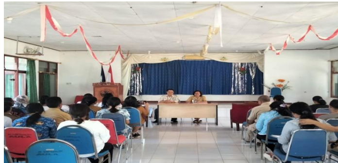
Gambar 1. Tim Memberikan Materi Secara Ceramah

Pada sesi pembukaan, peserta mendapatkan pemaparan materi konseptual mengenai komunikasi total. Materi mencakup pengertian komunikasi total, manfaatnya bagi anak tunagrahita ringan, serta strategi penerapannya dalam berbagai situasi, baik di sekolah maupun di rumah. Sesi ini dikemas dalam bentuk ceramah interaktif, sehingga peserta diberi kesempatan bertanya dan berdiskusi langsung dengan narasumber. Pemateri berasal dari dosen pendidikan luar biasa dan praktisi ahli dalam bidang komunikasi augmentatif dan alternatif. Tujuannya adalah membangun pemahaman dasar peserta sebagai bekal sebelum masuk ke sesi praktik.