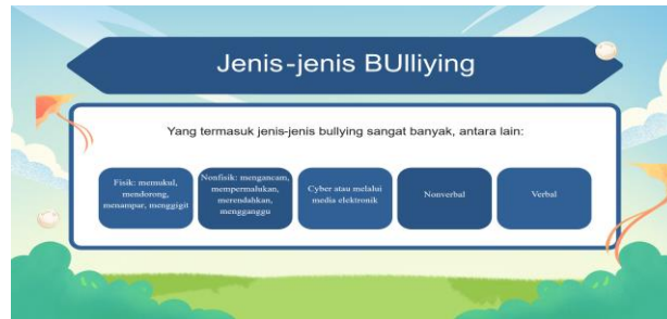
Gambar 1. Materi Sosialisasi