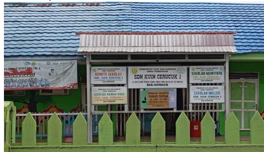
Gambar 5. Lokasi Pengabdian

SDN Kuin Cerucuk 1 Banjarmasin adalah satu sekolah yang mempunyai banyak catatan prestasi akademik ataupun non-akademik