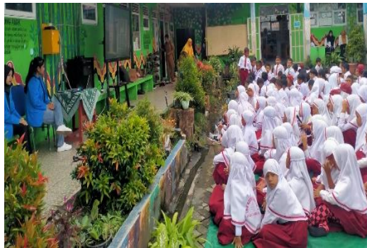
Gambar 2. Proses Sosialisasi