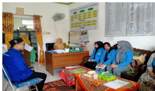
Gambar 3. Diskusi dengan Guru